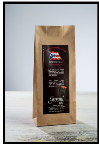
Portoriko „YAUCO SELECTO“ Velmi cenná Arabica, chutná po hořké čokoládě, sladu a kandovaném ovoci.