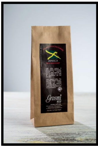
Jamaica „BLUE MOUNTAIN“ Legendární Arabica, velká vzácnost. S příchutí vanilky, rumu, mandlí a pistácií.