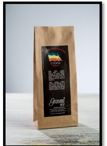
Etiopie „SIDAMO“ Velmi sladká a ovocná příchut'. Voní po citrusech a medu. Říká se jí káva „ze zahrady“. Spontánně roste poblíž banánovníků a z tohoto důvodu je její chuť jedinečná.