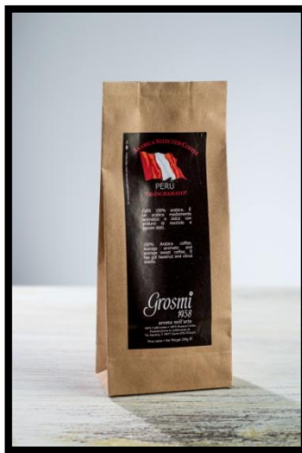
Peru „CHANCHAMAYO“ Jemná a sametová Arabica, kde doznívá chuť kakaá, lískových oříšků, broskví a grapefruitu.