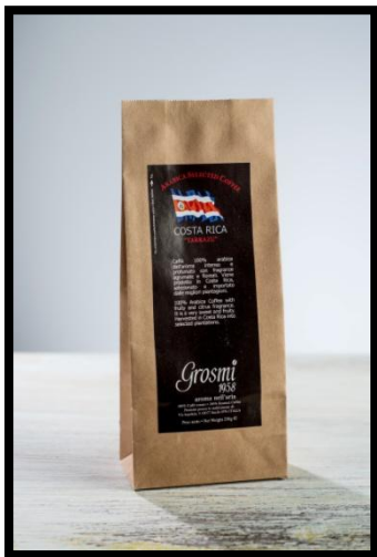
Kostarika „TARRAZU“ Arabica s intenzivní vůní květin a příjemnou chutí čokoládových bobů a karamelizovaného pomeranče.