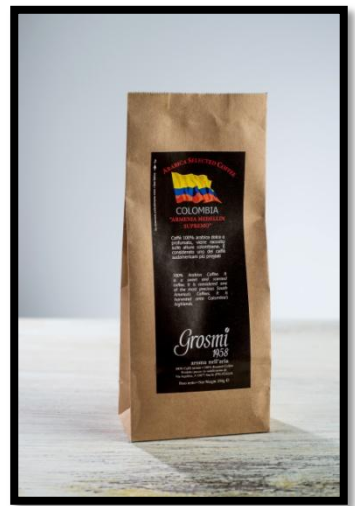
Kolumbie „ARMENIA MEDELLIN SUPREMO“ Strukturovaná chuť s příměsí čokolády, medu, čerstvého másla a vlašských ořechů. Tato Arabica je brána jako jedna z nejceněnějších káv Jižní Ameriky.